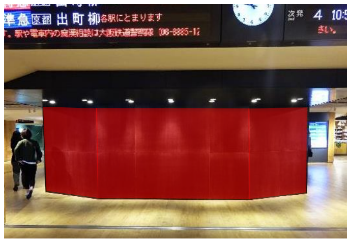
※シート掲出イメージ(最大サイズ)