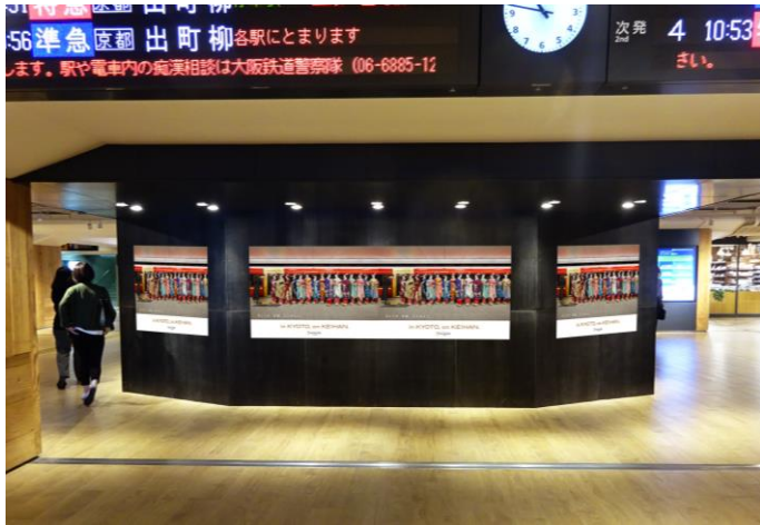
※ポスター掲出イメージ