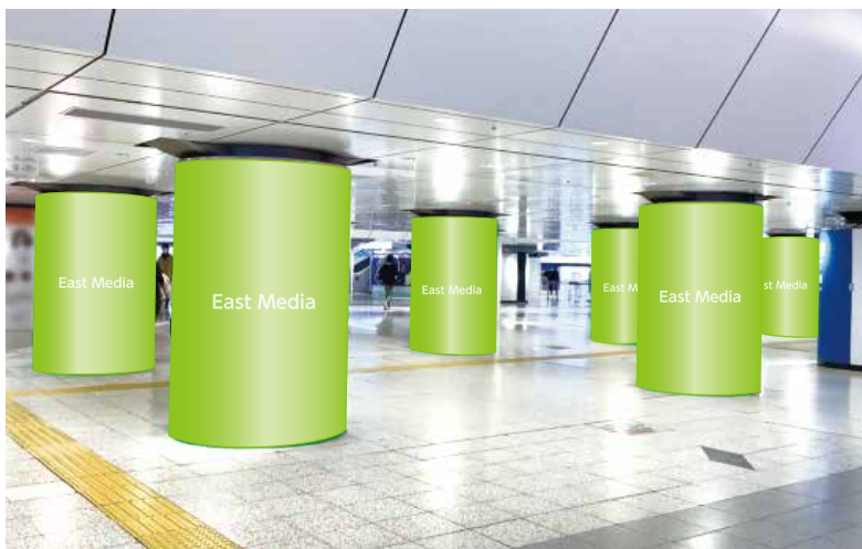
東京八重洲南口コンコースアドピラー