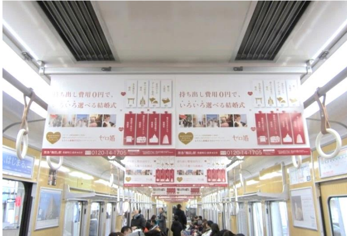
● B3シングル・B3ワイド共、上部に吊代約30mm必要。