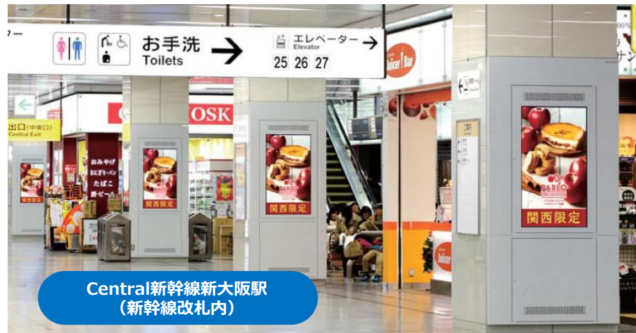
Central新幹線新大阪駅 (新幹線改札内)