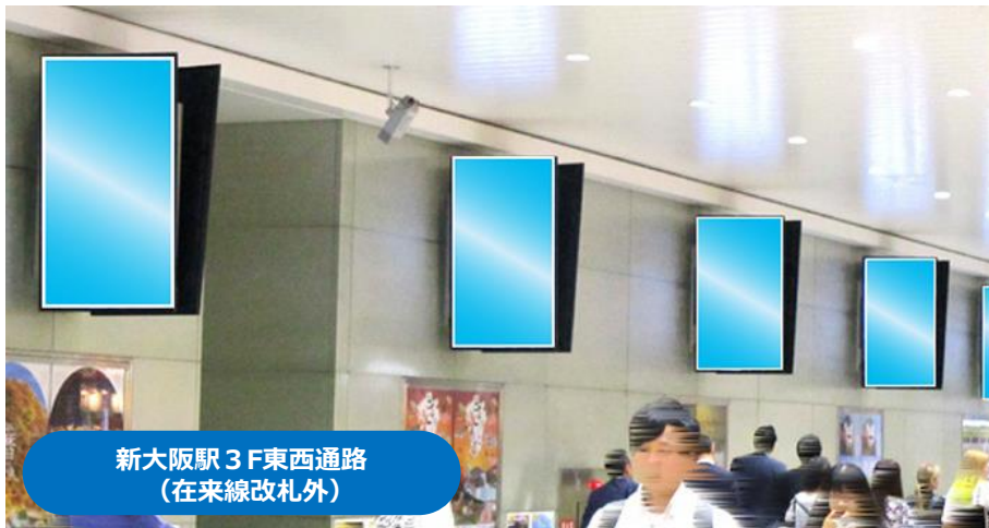
新大阪駅 3F東西通路 (在来線改札外)