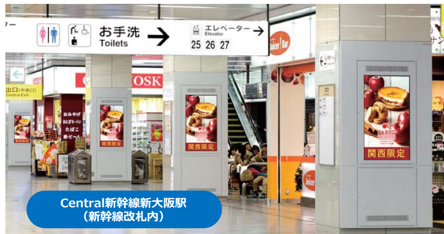
Central新幹線新大阪駅 (新幹線改札内)