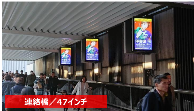
連絡橋 / 47インチ