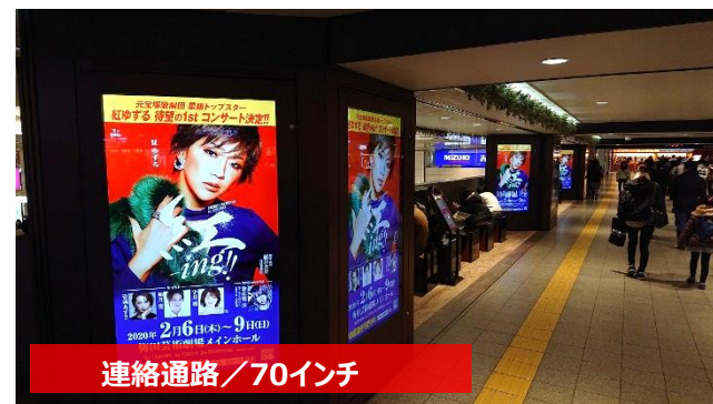
連絡通路 / 70インチ