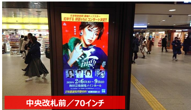
中央改札前 / 70インチ

2階中央改札前に17面、2階連絡橋7面、JR連絡通路に9面、計33面のデジタルサイネージセットです。 広範囲に渡る掲出を実現。また1クライアントによる独占放映も可能。注目度バツグンのオススメ媒体です！