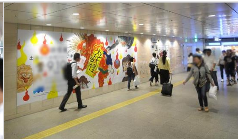
| 掲出イメージ |