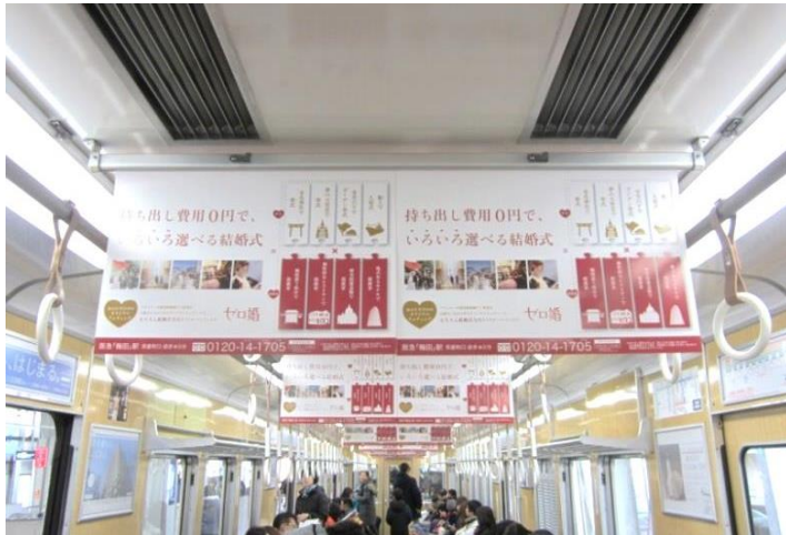
● B3シングル・B3ワイド共、上部に吊代約30mm必要。