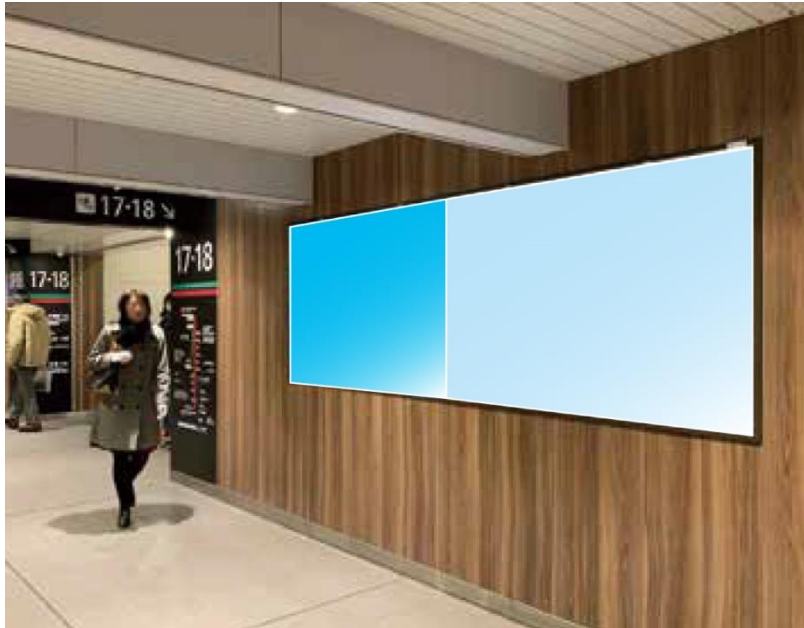
天王寺駅 (ハーフI) (ハーフII)